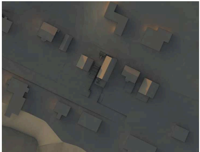
Kesäkuu klo 21