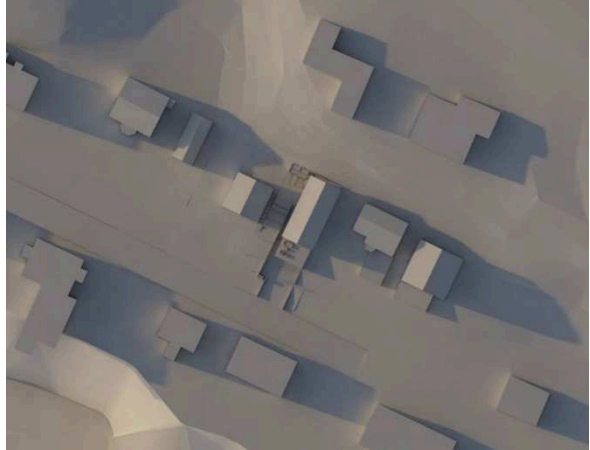
Kesäkuu klo 19