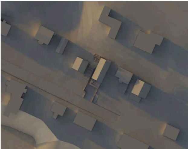
Kesäkuu klo 20